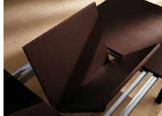
Particolare allungabile a libro Detail of the folding extension Détail du rallonge à livret Detail des Klappauszugs Detalle extensión de libro