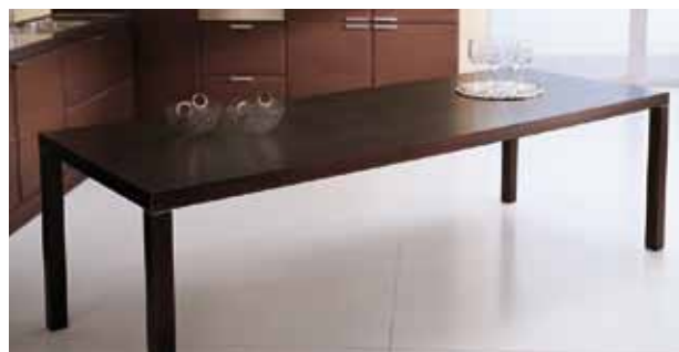
Tavolo fisso (non disponibile nella finitura Noce Canaletto) Fixed table (not available in the finish Walnut Canaletto) Table fixe (pas disponible dans la finition Noyer Canaletto) Fester Tisch (nicht verfügbare mit Nussbaum Canaletto Finishing) Mesa fija (no disponible en el acabado Nogal Canaletto)

La mesa Glam tiene la estructura de metal barnizado Gris Aluminio y las patas de madera maciza de Haya (1) o Roble (2) teñida en los colores mencionados anteriormente o enchapada en precompuesto color Teca (3). El tablero puede ser extensible o fijo, revestido con laminado en los colores mencionados anteriormente.