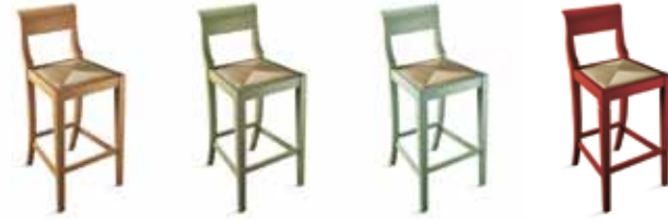
(1) Rovere Naturale Natural Oak Chêne Naturel Eiche Natur Roble Natural (1) Rovere Verde Antico Antique Green Oak Chêne Vert Patiné Eiche Grün Antik Roble Verde Antiguo (1) Rovere Azzurro Antico Antique Light Blue Oak Chêne Bleu Ciel Patiné Eiche Azur Antik Roble Celeste Antiguo (1) Rovere Rosso Red Oak Chêne Rouge Eiche Rot Roble Rojo