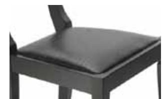
Fondino in pelle Leather seat Fond en cuir Sitzfläche aus Leder Asiento de piel

Lo sgabello Grand Relais ha fusto in massello di Frassino(1) o di Faggio(2) tinto nelle finiture sopra riportate. Il fondino è disponibile in paglia sintetica, impiallacciato Frassino(1) o Faggio(2) tinto nella stessa finitura del fusto.