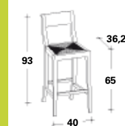
Fondino impagliato Straw seat Fond empaillé Strohgeflecht-Sitzfläche Asiento de paja