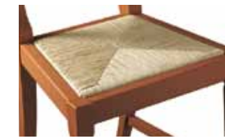
Fondino impagliato Straw seat Fond Empaillé Strohgeflecht-Sitzfläche Asiento de paja

SEATS AVAILABLE - DISPONIBILITE FONDS - LIEFERBARE SITZFLÄCHEN - DISPONIBILIDAD ASIENTOS