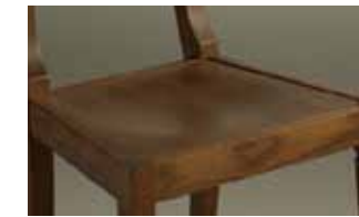
Fondino impiallacciato Veneered seat Fond plaqué Furnierte Sitzfläche Asiento enchapado