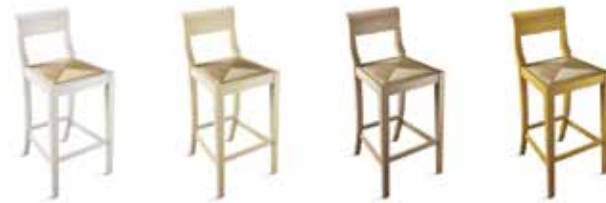
(1) Bianco con anticatura argento (1) Nero con anticatura argento (1) Rosso con anticatura argento (1) Verde con anticatura argento