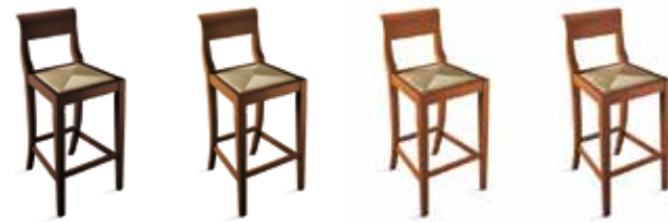
(1) Rovere Moro Dark Oak Chêne Foncé Eiche Dunkel Roble Oscuro (1) Noce Antico Antique Walnut Noyer Patiné Nussbaum Antik Nogal Antiguo (1) Noce Kyoto Kyoto Walnut Noyer Kyoto Nussbaum Kyoto Nogal Kyoto (2) Noce Anticato (Amelie) Antique-effect Walnut (Amelie) Noyer Antique (Amelie) Nussbaum Antikisiert (Amelie) Nogal Envejecido (Amelie)