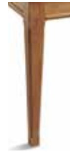
(2) gambe quadrate square-section legs pieds carrés viereckige Beine Patas cuadradas

Finiture disponibili - Finishes available - Finitions disponibles Lieferbare Finishes - Acabados disponibles