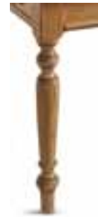
(1) gambe rotonde round-section legs pieds ronds abgerundete Beine Patas redondas