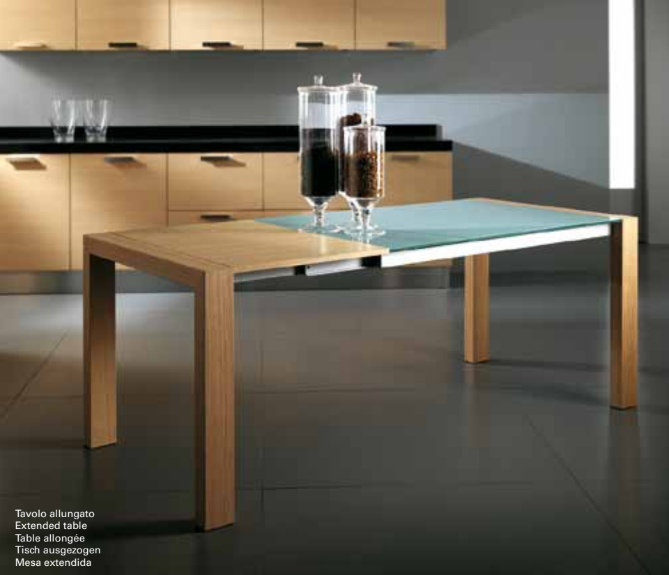
Tavolo allungato Extended table Table allongée Tisch ausgezogen Mesa extendida